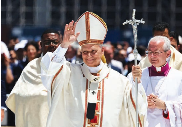
മാഡ്രിഡ്: ആഗോള കത്തോലിക്കാ സഭയുടെ തലവൻ ലെയോ പതിനാലാമൻ പാപ്പായുടെ നാലാമത് അപ്പസ്തോലിക യാത്ര സമാപിച്ചു. 15 വർഷങ്ങൾക്ക് ശേഷം ഒരു മാർപാപ്പ സ്പെയിനിൽ നടത്തുന്ന

സന്ദർശനമെന്ന ചരിത്രപരമായ പ്രാധാന്യവും ഇതിനുണ്ടായിരുന്നു. ജൂൺ ആറ് ശനിയാഴ്ച ആരംഭിച്ച ജൂൺ 12 വെള്ളിയാഴ്ച സമാപിച്ച, ഏഴു ദിവസം നീണ്ടുനിന്ന സ്പെയിൻ സന്ദർശനത്തിന് പ്രധാനമായും നാല് ഘട്ടങ്ങളാണ് ഉണ്ടായിരുന്നത്.