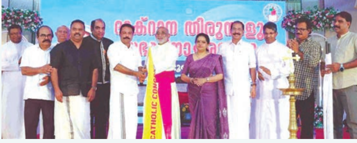
കാക്കനാട് കത്തോലിക്ക കോൺഗ്രസ് ഗ്ലോബൽ മീറ്റ് ഒക്ടോബർ 19 മുതൽ 23 വരെ ഇറ്റലിയിലെ റോമിൽ നടക്കും. ലോകത്തിന്റെ വിവിധ ഭാഗങ്ങളിലുള്ള 32 രാജ്യങ്ങളിൽ നിന്നുള്ള പ്രതിനിധികൾ പങ്കെടുക്കുന്ന സമ്മേളനത്തിന് പരിശുദ്ധ പിതാവ് ലെയോ പതിനാലാമൻ മാർപാപ്പ ആശീർവാദം നൽകുമെന്ന് ഭാരവാഹികൾ അറിയിച്ചു. ഗ്ലോബൽ മീറ്റിന് മുന്നോടിയായി 40 രാജ്യങ്ങളിലൂടെ സഞ്ചരിക്കുന്ന അന്താരാഷ്ട്ര പതാക പ്രയാണത്തിന് സീറോമലബാർ സഭയുടെ ആസ്ഥാന കാര്യാലയമായ മൗണ്ട് സെന്റ് തോമസിൽ തുടക്കമായി.