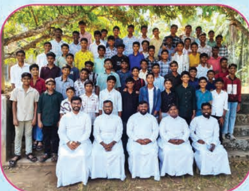
Come & See 2026