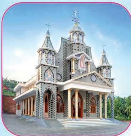
Newly Built Church Navoor