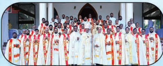
Priests of the Diocese