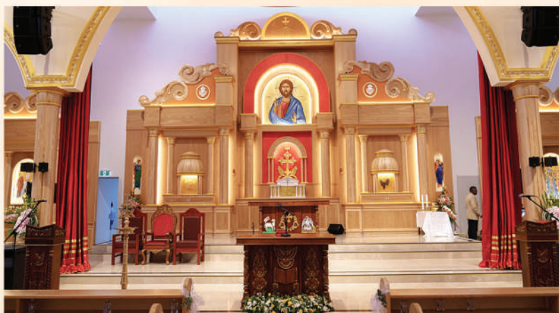
സെന്റ് അൽഫോൻസാ കത്തീഡ്രൽ

വളർച്ചയുടെ കണക്കുകൾ: നിലവിൽ 65,000-ത്തിലധികം വിശ്വാസികളും നിരവധി ഇടവകകളും മിഷൻ കേന്ദ്രങ്ങളുമായി രൂപത ക്രിസ്തീയ സാക്ഷ്യത്തിന്റെ ദീപമായി ജ്വലിച്ചുനിൽക്കുന്നു.