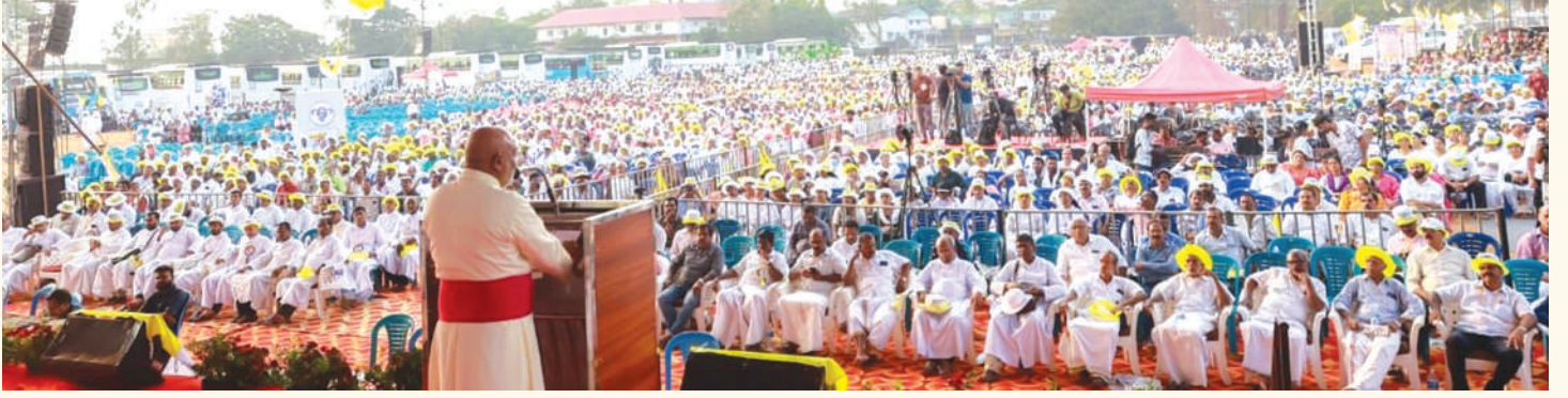
ശുശ്രൂഷയുടെ ഭാഗമാക്കി മാറ്റി.

വിദ്യാഭ്യാസ മേഖലയിൽ സർക്കാർ ചെയ്യേണ്ട കാര്യങ്ങൾ സമുദായം ചെയ്തതാണ് പള്ളിക്കൂടം. ജാതി അനുസരിച്ച് കുട്ടികൾ വസ്ത്രങ്ങൾ ഇടാത്തപ്പോൾ കത്തോലിക്കാസഭ നടത്തിയ പരിഷ്കാരമാണ് പള്ളിക്കൂടങ്ങളിലെ യൂണിഫോം. ജാതിവ്യവസ്ഥകൾ പള്ളിക്കൂടങ്ങളിൽ പാടില്ലെന്നു ബോധ്യപ്പെടുത്താനാണ് യൂണിഫോം സമ്പ്രദായം നടപ്പിലാക്കിയത്. സ്ത്രീകളുടെ വിദ്യാഭ്യാസത്തിലും തുല്യ അവകാശമുണ്ടെന്നു പറഞ്ഞത് കത്തോലിക്ക സമുദായമാണ്. നഴ്സാകാൻ ഒരുകാലയളവിൽ ആരും പോകാറില്ലായിരുന്നു. ആരോഗ്യമേഖലയിൽ സ്ത്രീകളുടെ ശുശ്രൂഷ ആവശ്യമാണെന്ന് പറഞ്ഞത് സമുദായമാണ്. സിസ്റ്റേഴ്സിനെ ഉൾപ്പെടെ ഈ മേഖലയിലേക്കു നിയോഗിച്ചത് സമുദായമാണ്. ഒരാളും നഴ്സാകാൻ വരാതിരുന്ന കാലഘട്ടത്തിൽ നഴ്സിംഗിനെ കത്തോലിക്കാ സഭ