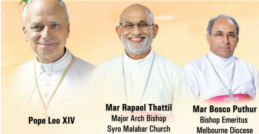
Pope Leo XIV