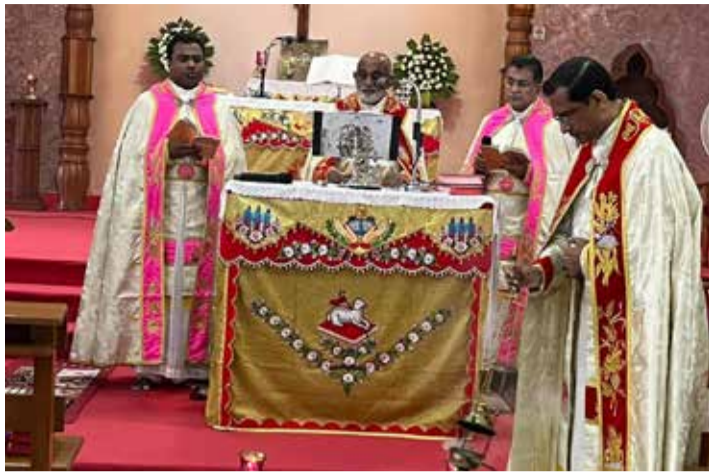
സീറോമലബാർ സഭയുടെ രണ്ടാമത്തെ മേജർ ആർച്ചുബിഷപ്പായിരുന്ന കർദിനാൾ മാർ വർക്കി വിതയത്തിൽ പിതാവിന്റെ പതിമൂന്നാമത് ചരമവാർഷികദിനത്തിൽ മേജർ ആർച്ചുബിഷപ്പ് മാർ റാഫേൽ തട്ടിൽ പിതാവിന്റെ കാർമികത്വത്തിൽ വി. കുർബാനയും ഒപ്പിസും നടത്തി.