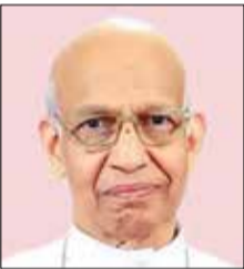
ബിഷപ്പ് ഓർ ജോർജ്ജ് പുത്തൻപുഴ