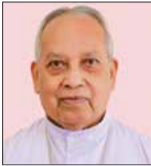
ആർച്ചുബിഷപ്പ് ഓർ ജോർജ്ജ് വലിയരറ്റം