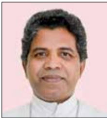
ബിഷപ്പ് ഓർ ജോർജ്ജ് വലിയരറ്റം