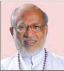
കർദ്ദിനാൾ ഓർ ജോർജ്ജ് ആലഞ്ചേരി