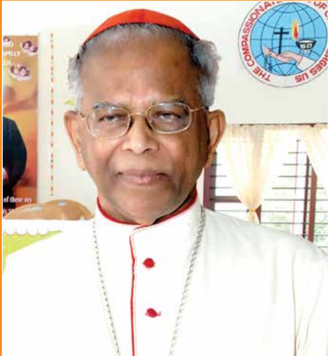
കർദ്ദിനാൾ ഓർ വർക്കി വിതയത്തിൽ

സീറോമലബാർസഭയുടെ രണ്ടാമത്തെ മേജർ ആർച്ചുബിഷപ്പ് (1996 നവംബർ 11 2011 ഏപ്രിൽ 1)