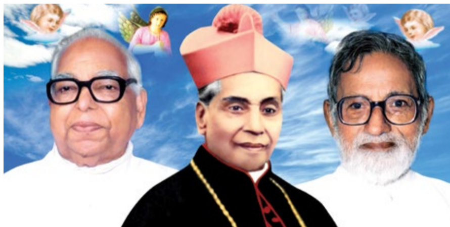
ഏതു പ്രവർത്തനങ്ങളിൽ ഏർപ്പെടാലും കുടുംബം എന്ന ലക്ഷ്യത്തിൽനിന്ന് അവർ വ്യതിചലിച്ചിട്ടില്ല. കുടുംബങ്ങളെ രക്ഷിക്കാനുള്ള യാത്രയ്ക്കിടയിൽ മരിക്കേണ്ടിവന്നാൽ അതാണ് ഏറ്റവും നല്ല മരണമെന്ന് സ്ഥാപകപിതാക്കന്മാർ നൽകിയ പാഠമാണ് ഇവരുടെ മൂലധനം.