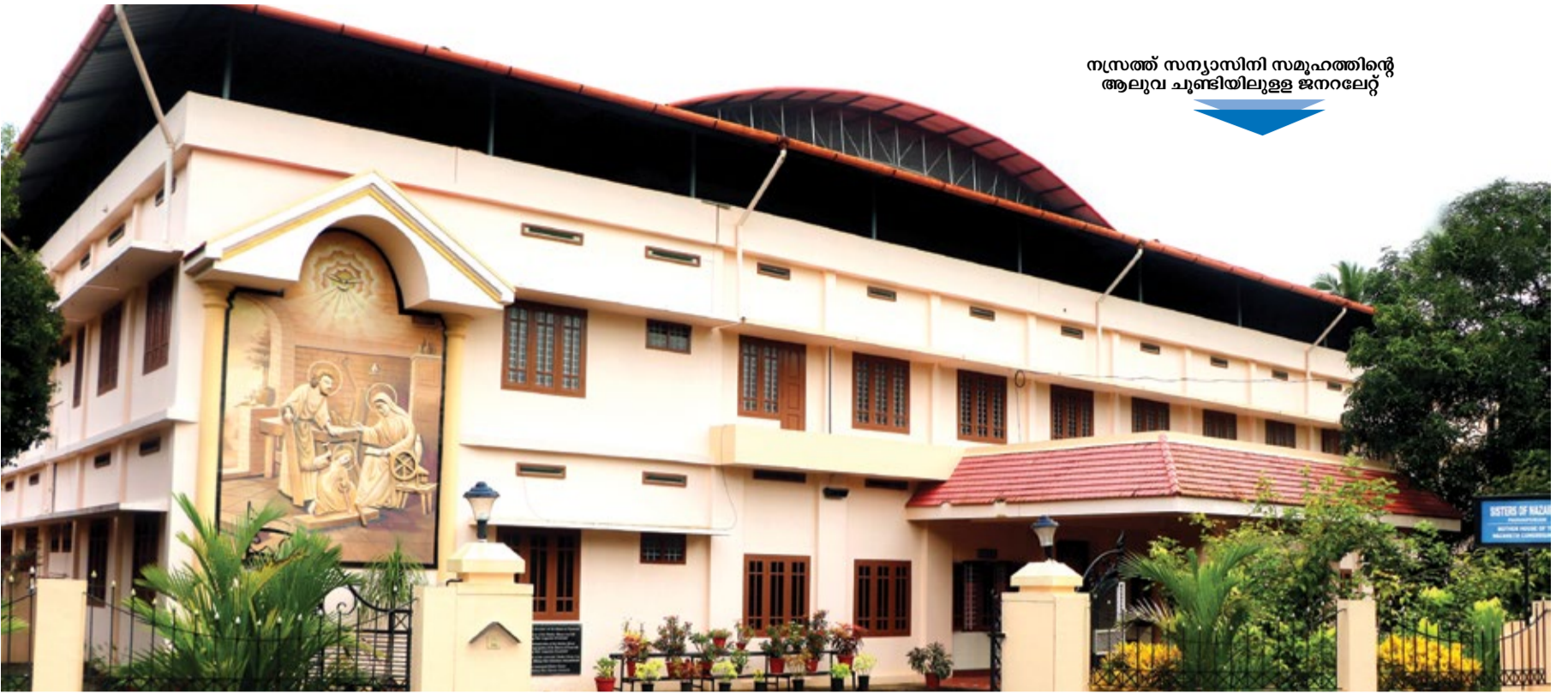
നസ്രത്ത് സന്യാസിനി സമൂഹത്തിന്റെ ആലുവ ചുണ്ടിയിലുള്ള ജനറലേറ്റ്