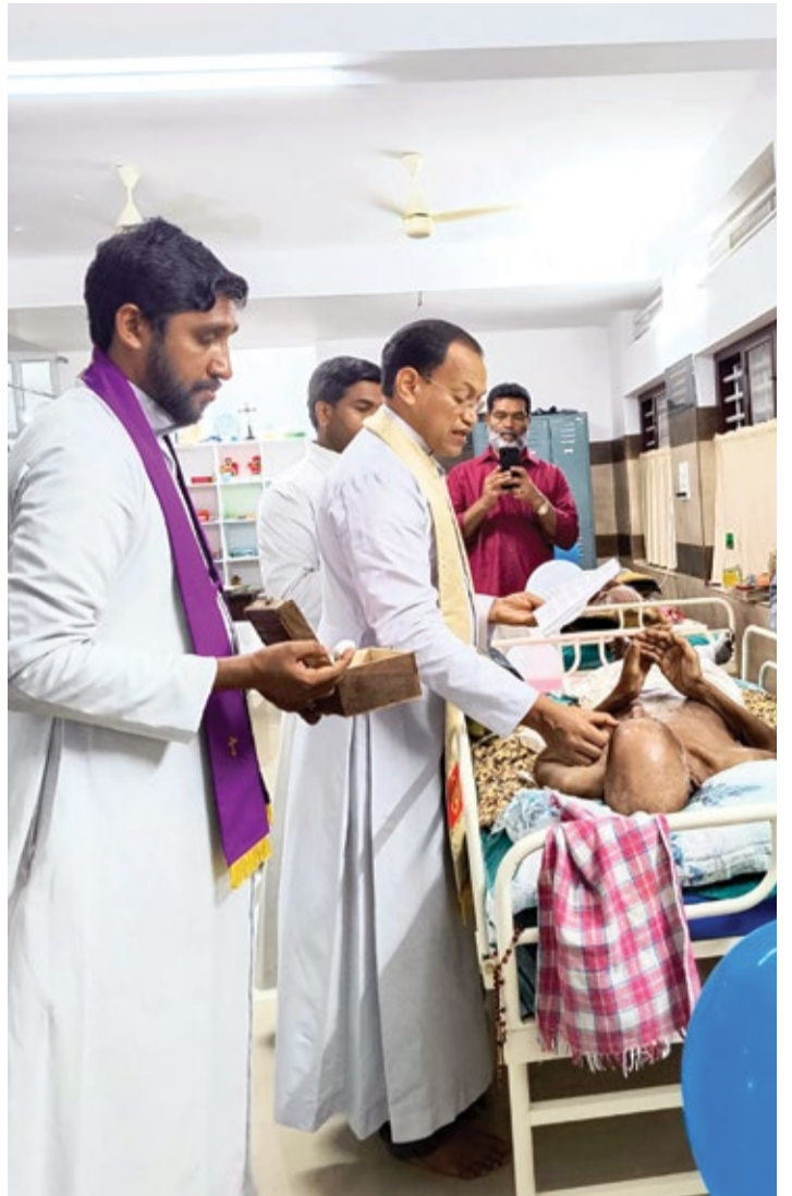
ഹൃദയ പാലിയേറ്റീവ് സെന്റർ