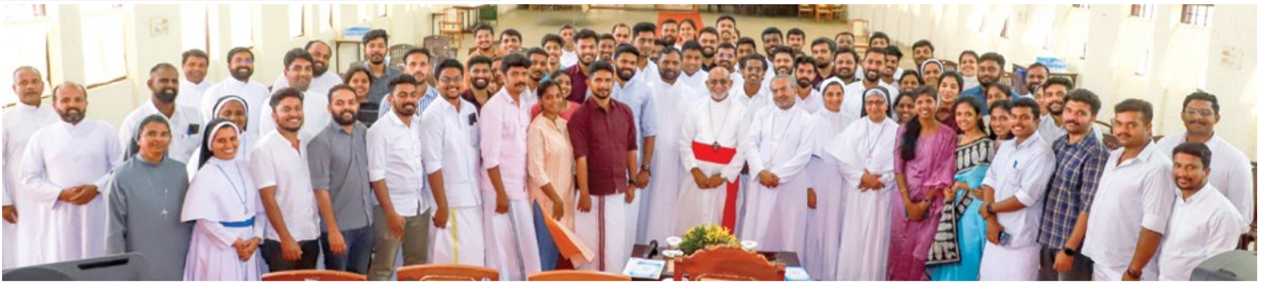
2024 ആഗസ്റ്റ് മാസത്തിൽ നടക്കാനിരിക്കുന്ന സീറോമലബാർ മേജർ ആർക്കിഎപ്പിസ്കോപ്പൽ അസംബ്ലിയുടെ ഒരു കമാന്റ് യൂണിറ്റിന്റെ അംഗങ്ങളുടെ ഒരു പാനം യുവജനങ്ങൾക്കായി കാക്കനാട് മൗണ്ട് സെന്റ് തോമസിൽ വെച്ചുനടത്തപ്പെട്ടു. എൻപതോളം യുവജനങ്ങൾ പങ്കെടുത്ത സെമിനാറിന് എസ് എം വൈ എം ഭാരവാഹികളും അസംബ്ലിയുടെ ഓർഗനൈസേഷൻ കമ്മിറ്റിയും നേതൃത്വം നൽകി.